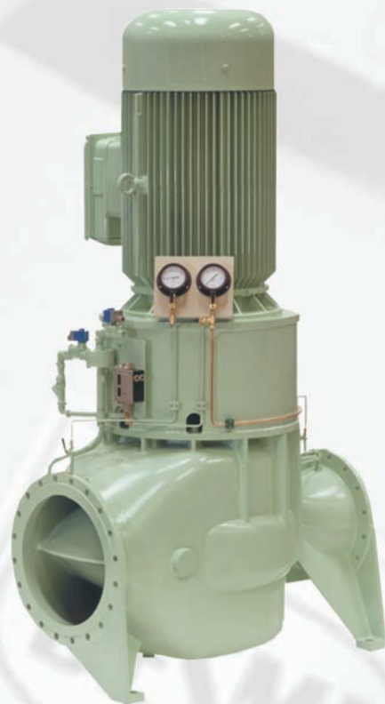
立式管道离心泵, DSL 型号

无论单台泵还是成套的泵机组，代斯米员工总能找到正确的解决方案。我们遍及全球的分公司和分销商确保备件的及时供应和一流的售后服务。