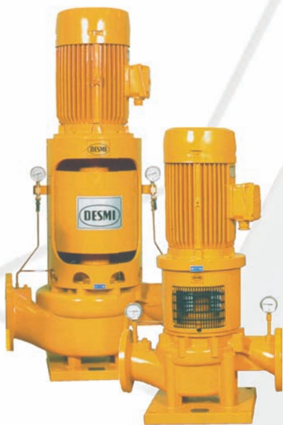
立式管道离心泵, NSL型号

紧凑型 and 加长联轴器型 流量范围：可达 4000\text{m}^3/\text{h} 扬程范围：3-40mWC